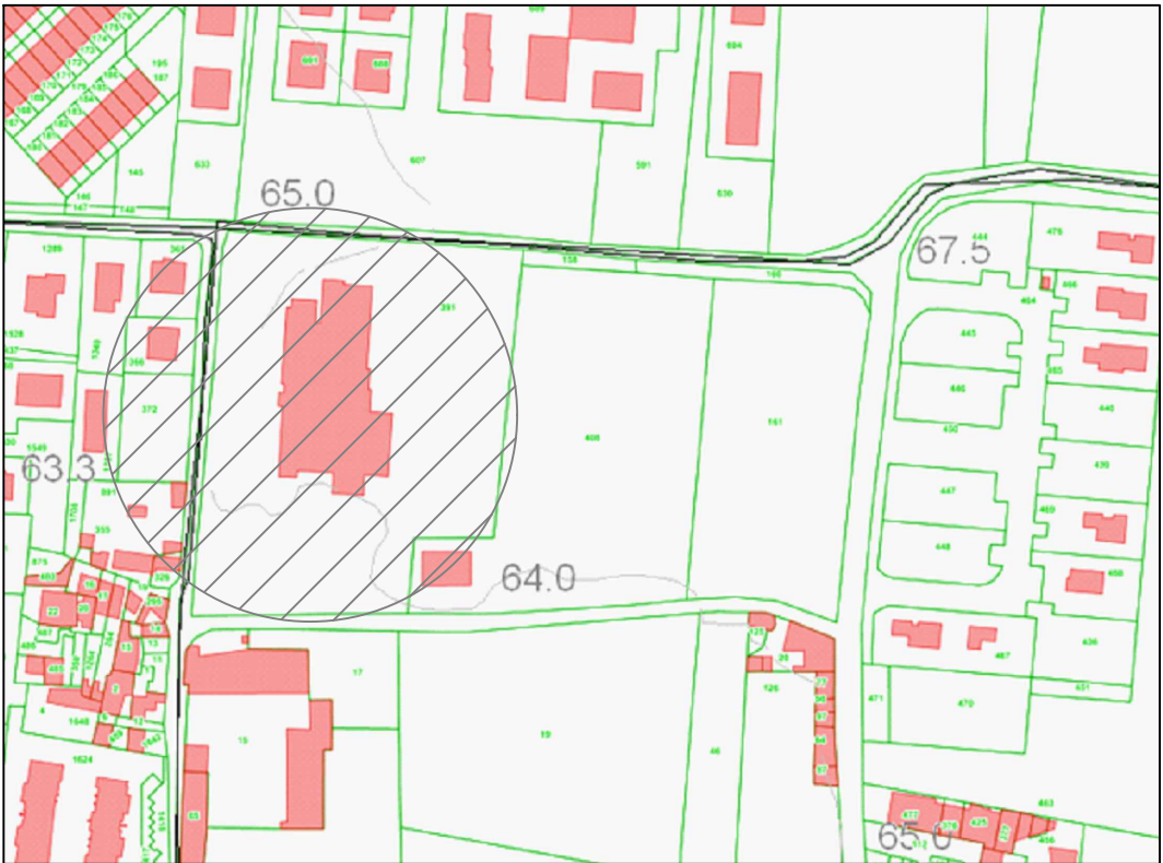
Catastale scala 1:2000 - Fg.11 p.Ila 395